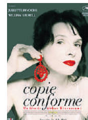
DVD FILM Abbas Kiarostami Copie Conforme A-Film