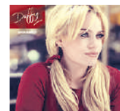
CD POP Duffy Endlessly Universal

„De cameraman gaat voor het beste shot zo dicht bij de huilende persoon staan dat de arm op de schouder buitengewoon dichtbij is. Maar dat zal hij nooit doen.”