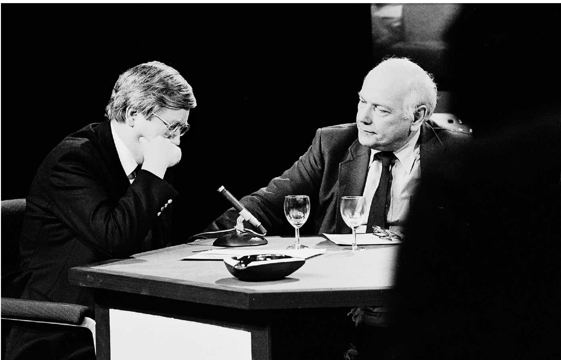
VVD-lijsttrekker Wiegel kan zijn emoties niet de baas tijdens een verkiezingsdebat in mei 1981. Jooop den Uyl troost hem en fotograaf Verhoeff drukt af.

Aan het begin van het nieuwe jaar belicht Trouw werken die een culturele omslag hebben ingeluid. Aflevering 2: De tranen van Wiegel.