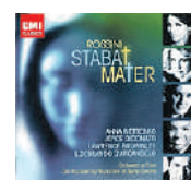
CD KLASSIEK Antonio Pappano Rossini Stabat Mater EMI

deze wisseling van de wacht weinig gevolgen. Het enige verschil is dat de songs ditmaal wat droger en minder zwaar aangezet klinken. Maar de cross-over van pop, blues en soul is in stand gebleven en het album bevat daarnaast weer de nodige potentiële hits. De single 'Well well well' is net zo'n knaller als 'Mercy' en 'Don't forsake me' is een aangrijpende smartlap. Bovendien ademt het album als geheel zo'n warme en doorleefde sfeer, dat 'Endlessly' bijna niet meer uit je cd-speler te branden is. (SB)