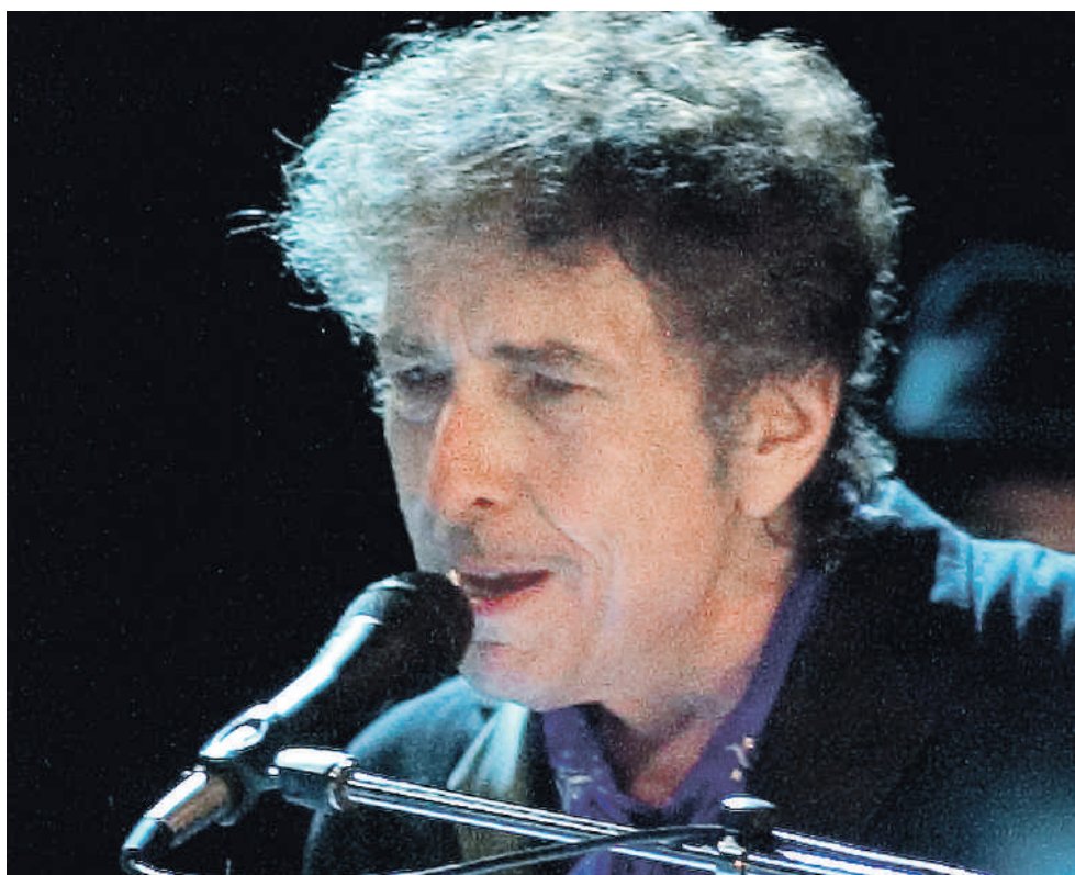
Blowin' In The Wind had best anders kunnen klinken.